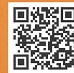
ホームページ QRコード

ヤマテック(株)ウィズリフォーム 〒259-1143 神奈川県伊勢原市下糟屋1643 TEL. 0120-053-910 MAIL: info@with-reform.net